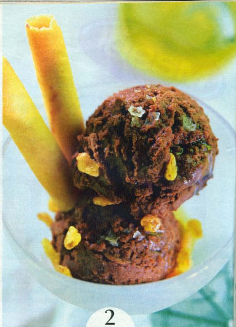
De azafrán con cornicabra